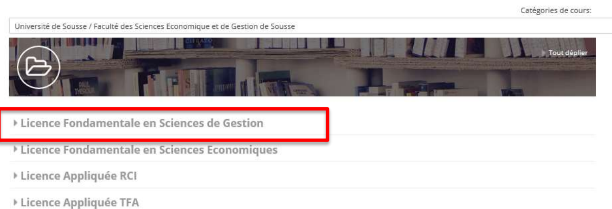
Tableau de bord > Mes cours > Université de Sousse > Faculté des Sciences Economique et de Gestion de S...